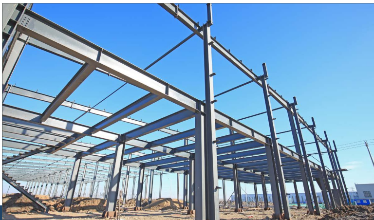
Konstrukcja stalowa hali

Nowy oddział konstrukcji stalowych składa się z trzydziesto-osobowego zespołu, który może się pochwalić ponad 20-letnim doświadczeniem w branży. Oferujemy „skrojone na miarę” kompletne rozwiązania od jednego dostawcy. Konstruujemy, analizujemy wszelkie obciążenia graniczne zgodnie z indywidualnymi życzeniami i przejmujemy wszystkie wymagane obliczenia statyczne. Zapewniamy też oczywiście transport, a także szybki i bezproblemowy montaż, ponieważ możliwie jak najwięcej elementów jest przez nas już wstępnie zmontowanych.