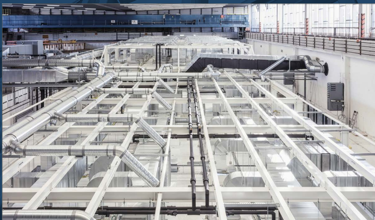
Konstrukcja nośna systemu pomieszczeń sterylnych (Clean Room)