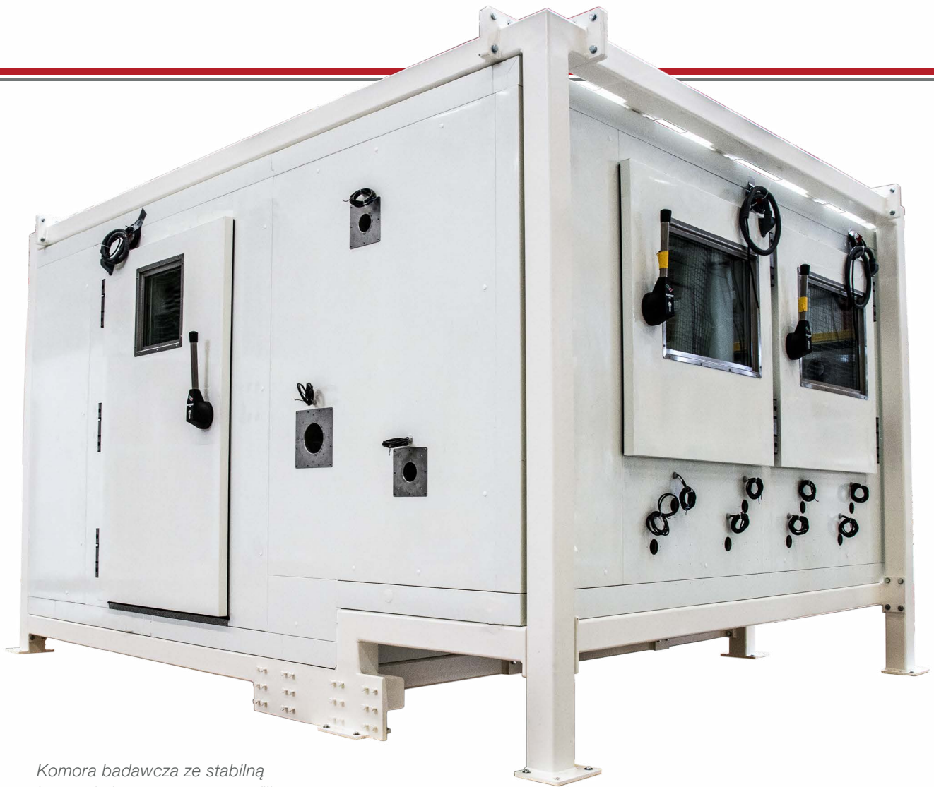
Komora badawcza ze stabilną konstrukcją zewnętrzną z profili stalowych